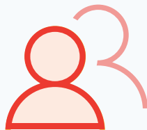
កំណត់ចំនួនមនុស្ស នៅកន្លែងរៀបចំ ម្ហូបអាហារនានា។