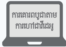
សេវាកម្មសាសនាតាម ការហៅជាវីដេអូគឺជាវិធី ដែលមានសុវត្ថិភាពបំផុត ក្នុងការគោរពបូជា។