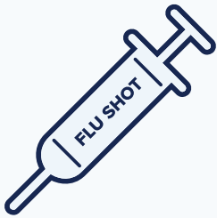
ចាក់ថ្នាំវ៉ាក់សាំងជំងឺ គ្រុនផ្តាសាយ។