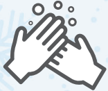
លាងសម្អាត និងធ្វើ អនាម័យដៃរបស់លោកអ្នក